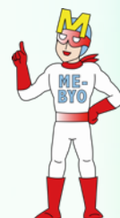
神奈川県キャラクター 未病改善ヒーローミビョーマン