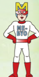
神奈川県キャラクター 未病改善ヒーローミビョーマン