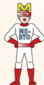
神奈川県キャラクター 未病改善ヒーローミビョーマン