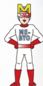
神奈川県キャラクター 未病改善ヒーローミビョーマン