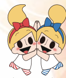
ミビョーナ・ミビョーネ (かながわ未病改善宣言イメージキャラクター)